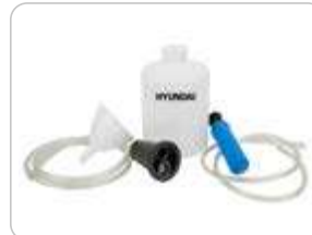
KIT EXTRACTOR ACEITE (▲) HY-OILEX16