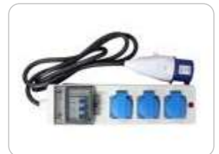
ADAPTADOR ITC DE 32A A 16A (▲) AC-ADAPT32-16